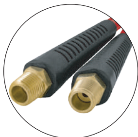
CON CONEXIONES 1/4" NPT